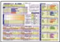
リスニング音源 (リスニング選択 の場合のみ)